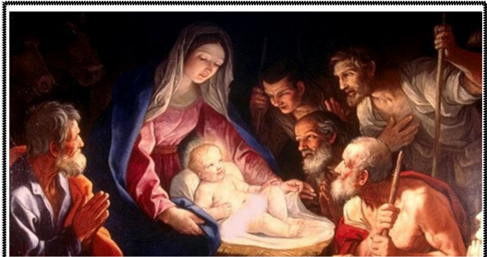
Ծնորհաւոր Նոր Տարի եւ Սուրբ Ծնունդ

The Feast of Theophany (Asdvadzahaydnootyoon) , meaning the “revelation of God” or God revealing Himself to mankind, is one of the five great tabernacle (Daghavar) feasts of the Armenian Church and it is always celebrated on January 6. This feast combines the celebration of the birth, baptism and manifestation of Our Lord Jesus Christ. The Feast of Theophany is an eight-day celebration from January 6 to 13.