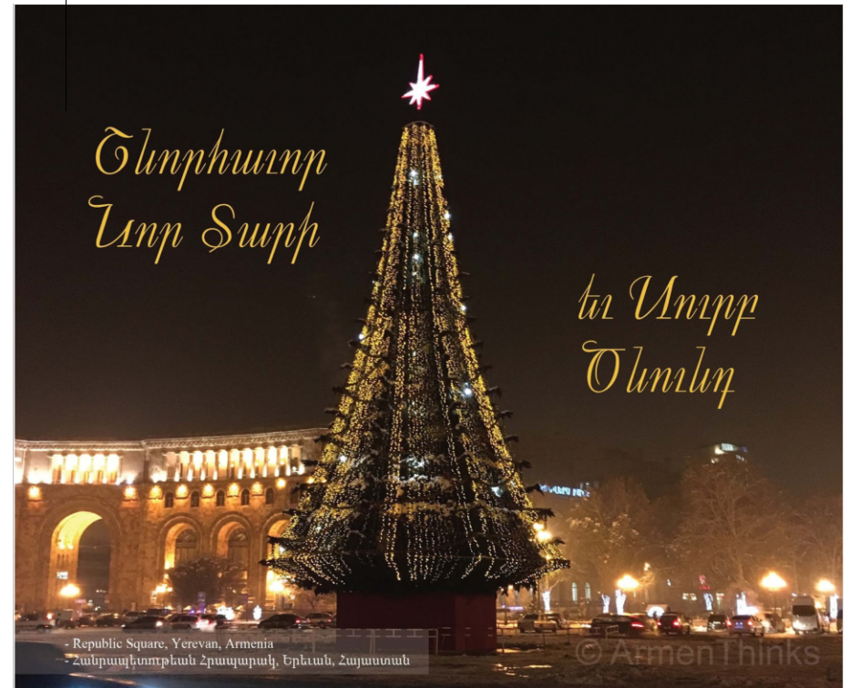
Republic Square, Yerevan, Armenia Հանրապետութեան Շրպարակ, Երևան, Հայաստան