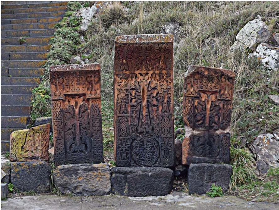
“Khatchkars of Armenia” Sevanavank Monastery – Lake Sevan, Armenia