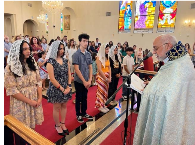
St. Gregory newly-elected ACYO Board members taking oath at the end of Badarak on Sunday, Sept. 10, 2023

In 610 A. D, the Persian King Khosrov with a large army attacks the Byzantine Empire. Enthusiastic about the initial victory, in 614 A. D. the Persian army enters Jerusalem. Many people are killed and many are imprisoned. Pontiff Zakaria, the Patriarch of Jerusalem is imprisoned, too. However, the Persians are not satisfied and enter the Church of Holy Sepulchre and take the