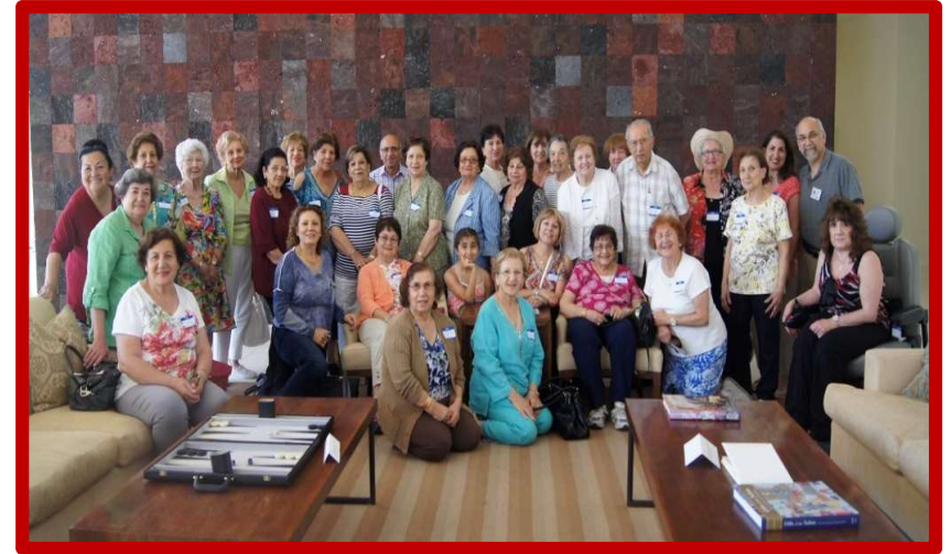
2010 – St. Gregory's Bus Trip to the Desert