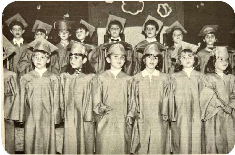
Hovsepien School Commencement Exercises - 1987