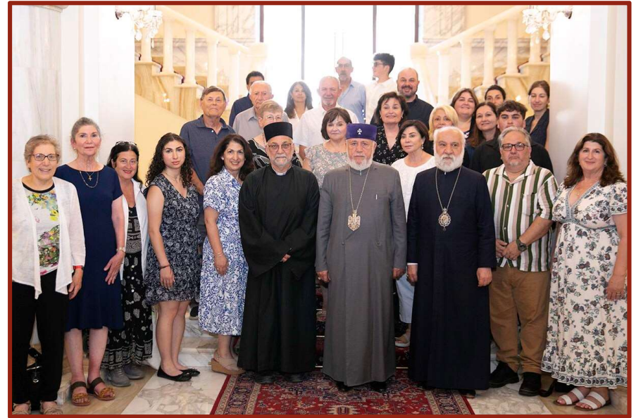
Catholics of All Armenians Welcomes Pilgrims from St. Gregory the Illuminator Armenian Church of Pasadena

November 11: Vincent van Gogh's painting Iris sell for a record $53.6 million at auction.