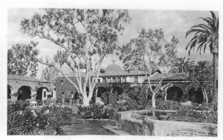
For Reservations, Please call