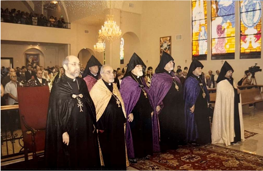
Consecration of St. Gregory the Illuminator Armenian Church of Pasadena - 2007