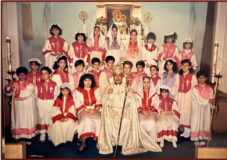
St. Gregory Hovsepian School Choir – 1980s