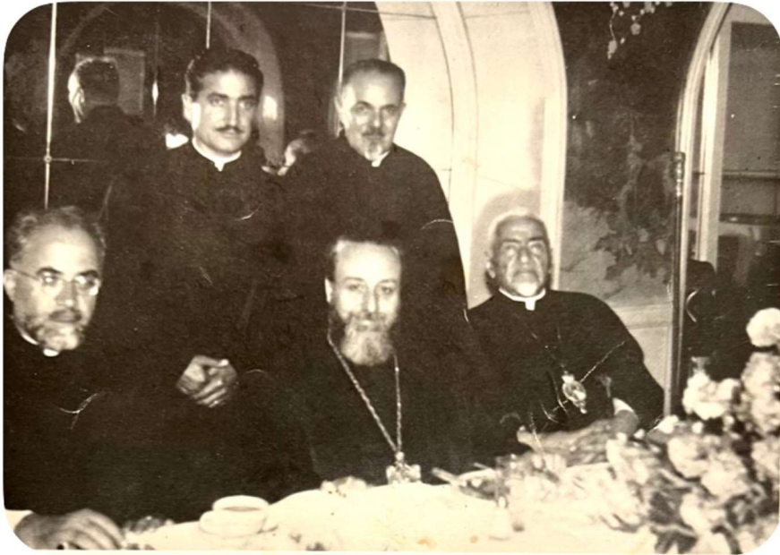
His Holiness Vazken I in Pasadena - 1960