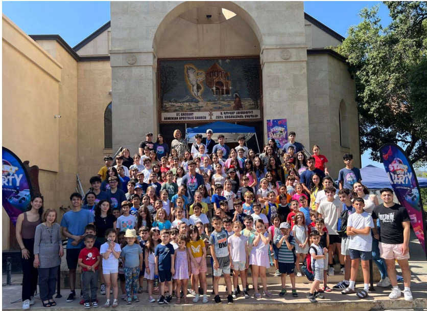
St. Gregory's "Vacation Bible School" June 24 – 28, 2024