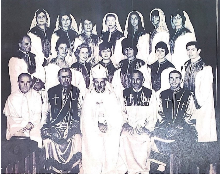
St. Gregory Choir 1962, Pasadena in Michigan Ave. Church