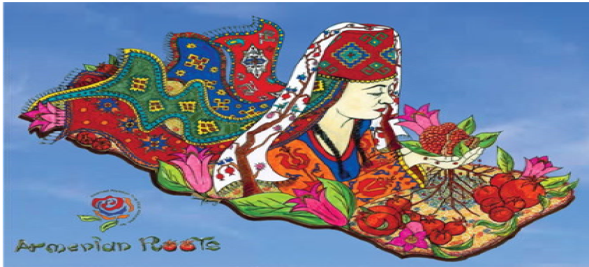
Armenian Float 2018