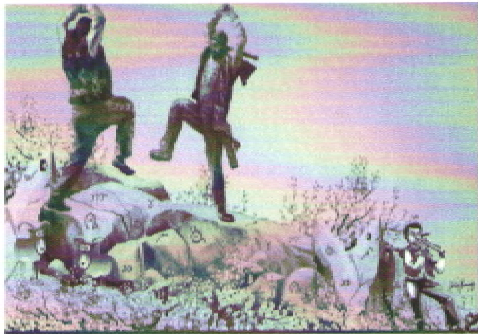
Armenian Float 2019

ST. GREGORY THE ILLUMINATOR ARMENIAN APOSTOLIC CHURCH