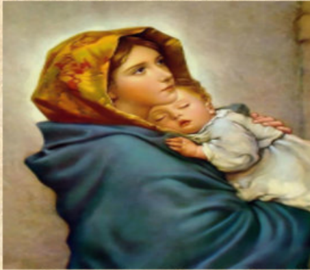
Assumption of the Holy Mother- of- God Վերափոխումն Ա-Աստուածածնի Sunday August 16, 2020

We are limited to have only 10 people in church, that includes priest, deacons, organist soloist, streamline technicians, and PC members