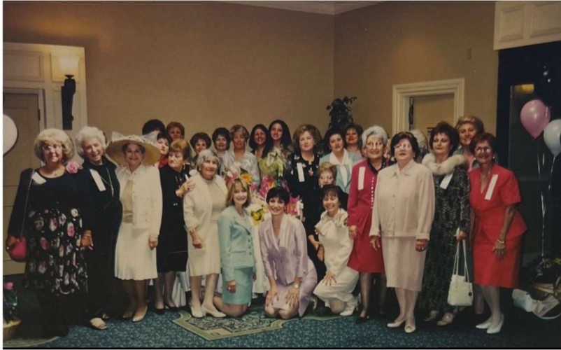
St. Gregory Ladies Society 36 th Annual Luncheon - Hilton Hotel, Pasadena April 21, 2001