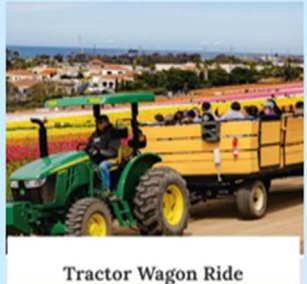
Tractor Wagon Ride