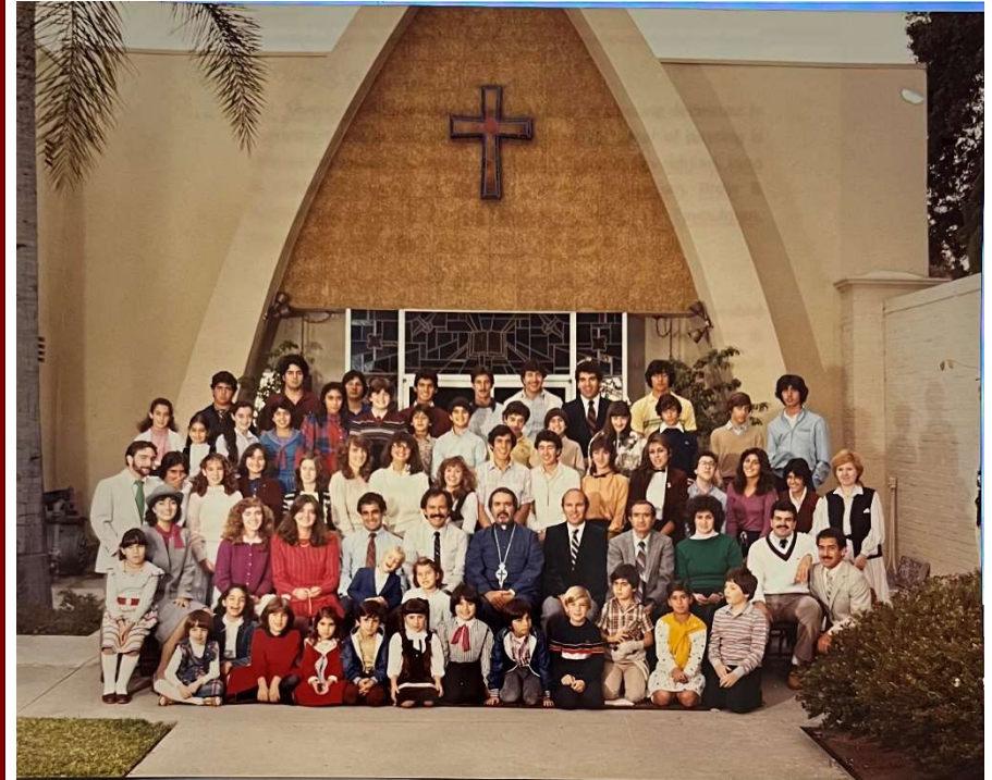
St. Gregory Saturday School: 1982 – 1983 Academic Year