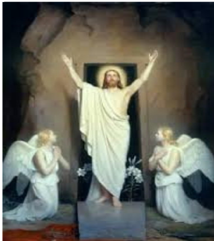
CHRIST IS RISEN