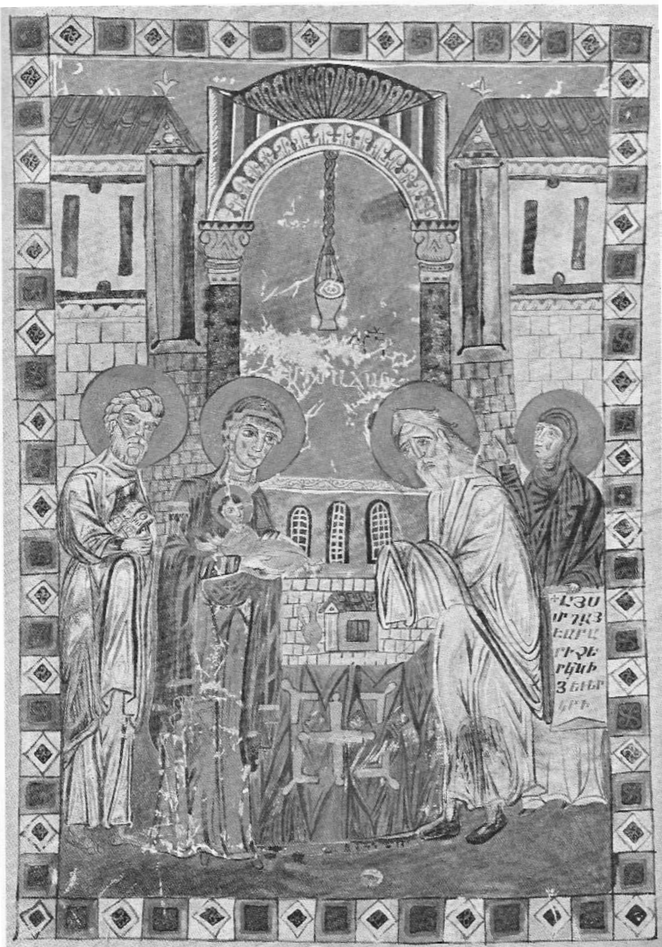
“The Presentation in the Temple”