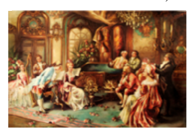
"The Royal Music with Mozart" Oil Painting (24"x 36")

At St. Gregory the Illuminator Armenian Apostolic Church 2215 E. Colorado Blvd. Pasadena, CA 91107