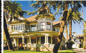
1906 Bembridge House Historic Long Beach