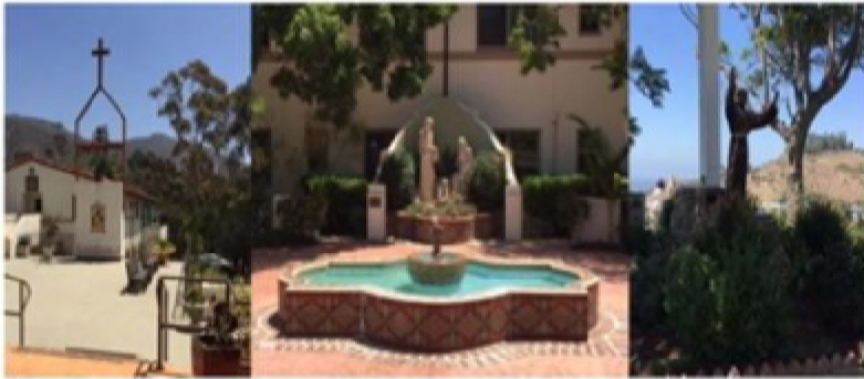
The Parables of Jesus "An earthly story with a heavenly meaning"

RELIGIOUS RETREAT COMMITTEE OF THE WESTERN DIOCESE Under the Auspices of His Eminence Archbishop Hovnan Derderian, Primate of the Western Diocese Presents Annual Retreat