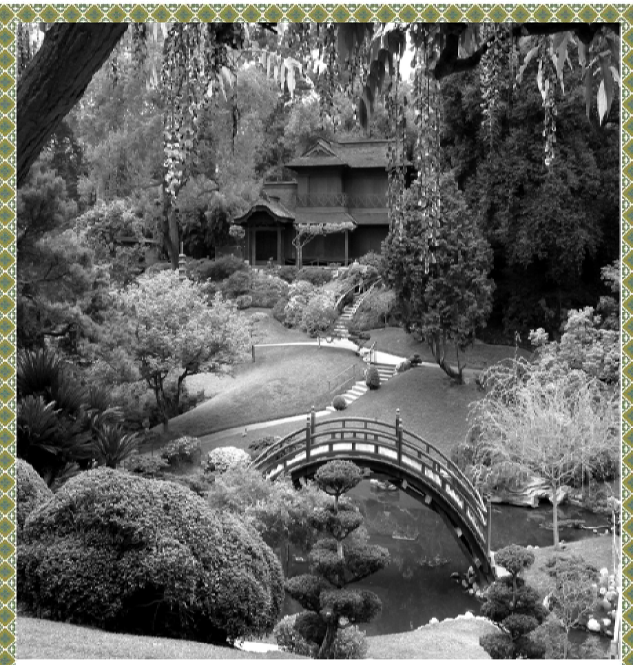
Huntington Library & Gardens ACYO Event

Please join ACYO at the Huntington Library and Gardens on the fourteenth of November.